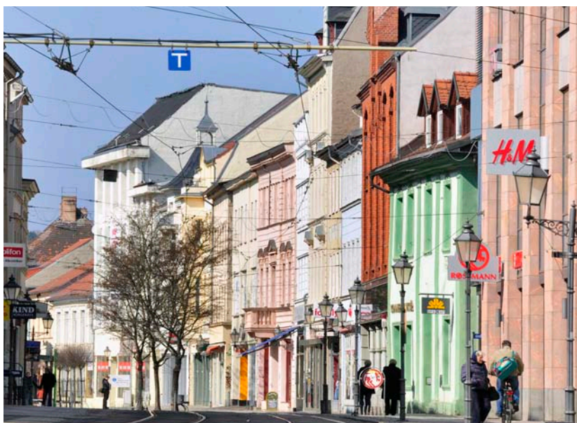
Wir als CDU-Fraktion setzen uns dafür ein, das Einzelhandelskonzept im Sinne der gesamten Stadt fortzuschreiben.

Im Gegensatz dazu sprechen wir uns auch weiterhin dafür aus, die Entwicklung von Einzelhandelszentren im gesamtstädtischen Kontext zu betrachten. Mit dem von der Verwaltung vorgelegten Entwurf zur Fortschreibung des Einzelhandelskonzeptes, an dem auch wir als CDU-Fraktion aktiv mitgewirkt hatten, wäre das möglich.